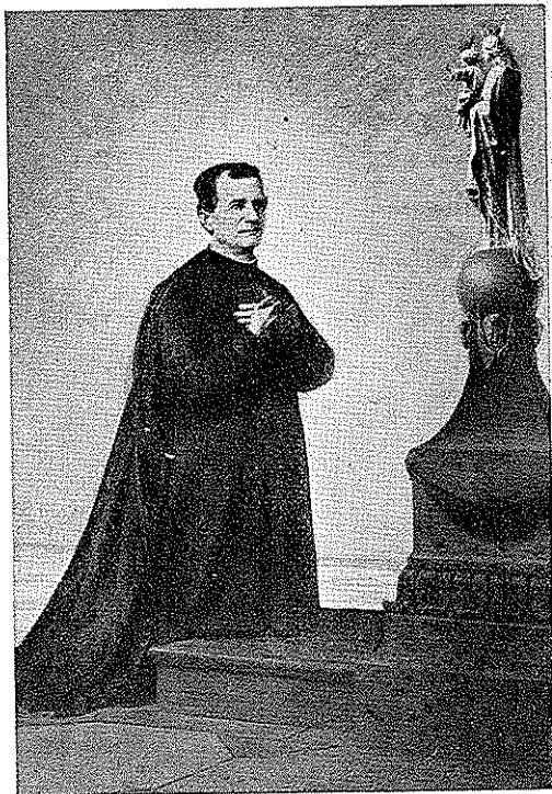
G. ROLLINI - San Giovanni Bosco in preghiera.

SOCIETÀ EDITRICE INTERNAZIONALE TORINO - MILANO - GENOVA - PARMA - ROMA - CATANIA